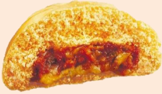
具たっぷりピザまん