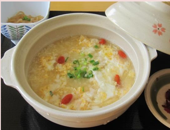
薬膳雑炊 (小鉢・漬物付き)

一般食堂のメニューが10/17(木)から一部変更になります。是非一度、ご賞味下さい。