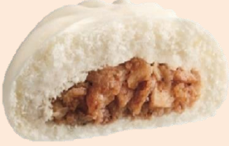
具たっぷり肉まん